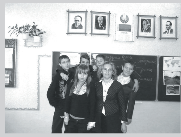
Мы зрабілі гэтае!