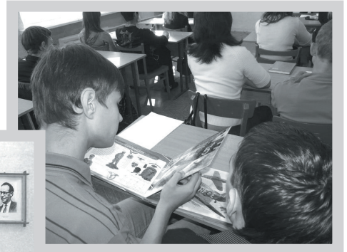
«Бітва за Англію» ў карцінках

Для 11 класа сярэдняй школы ка- манда трэнераў «Прадслава» распавя- ла пра ход Другой сусветнай вайны